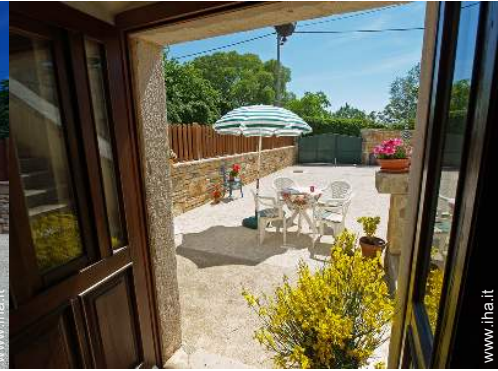
Casa in Pietra