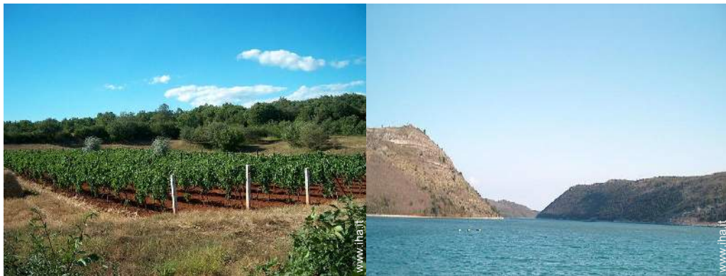
vista sui vigneti