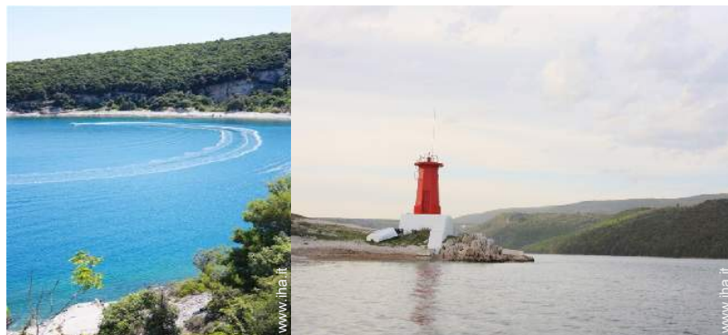
barca a motore