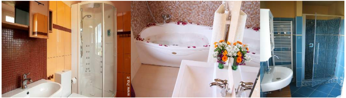
Comfort interno a disposizione degli ospiti