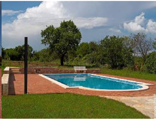
vista sul prato