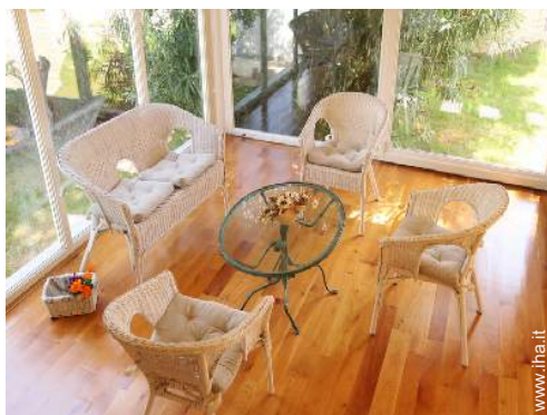
Comfort interno a disposizione degli ospiti