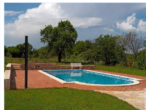
vista sul prato