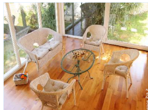
Comfort interno a disposizione degli ospiti

Cucina esterna, salotto estivo, forno per pizze, barbecue, tavolo da giardino, 10 sedia (e) da giardino, ombrellone, salotto da giardino, 10 chaise(s) longue(s), doccia esterna, WC esterno