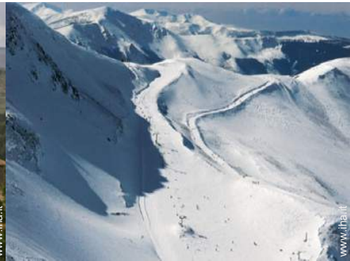
piste di sci