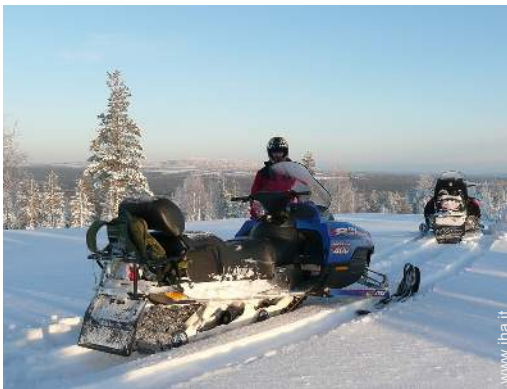
sport invernali nelle vicinanze