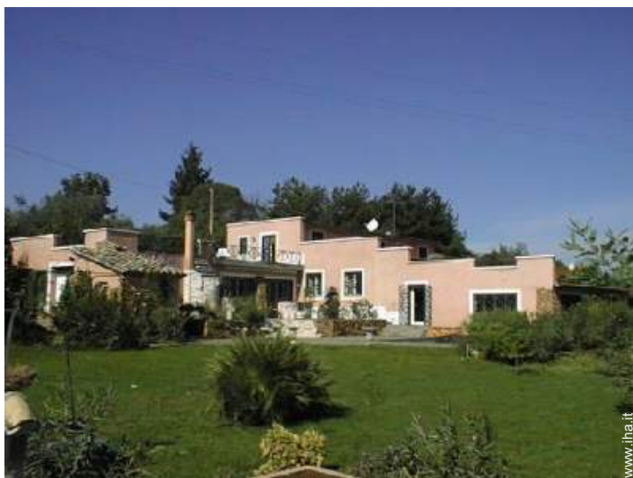
Villa di Charme