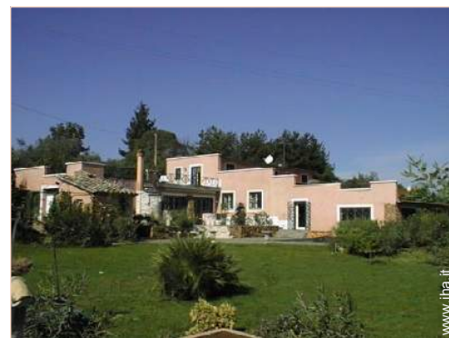
Villa di Charme