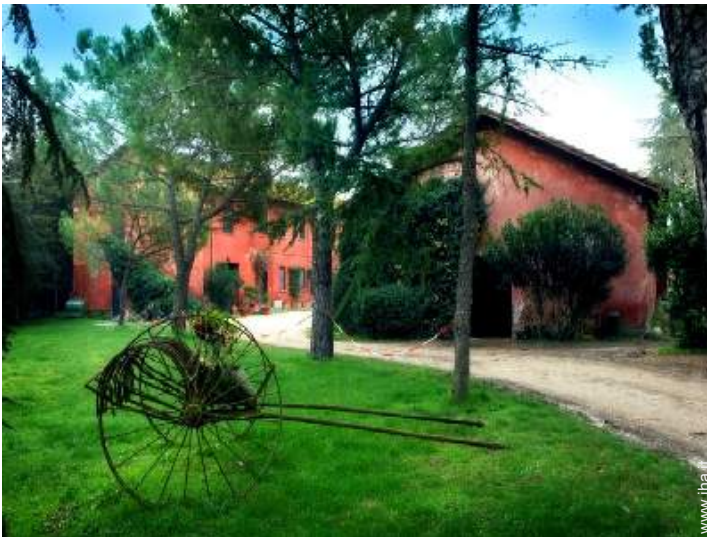
Antica Fattoria di Charme