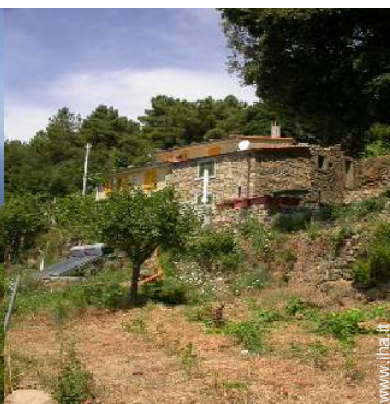
vista sui vigneti