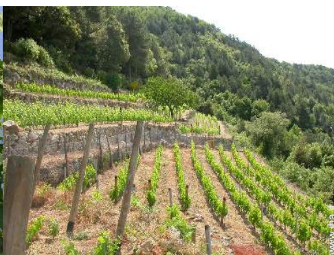
vista sui vigneti