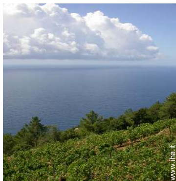
vista sui vigneti