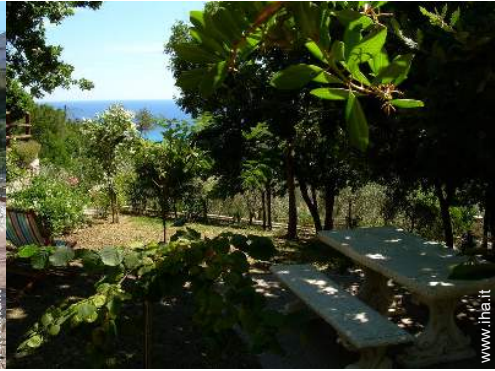
Installazione esterna a disposizione degli ospiti