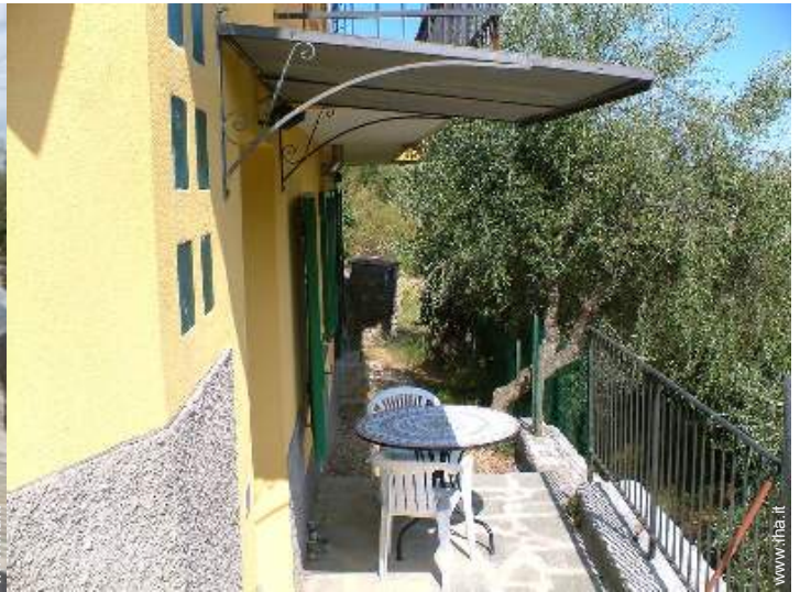
tettoia di giardino