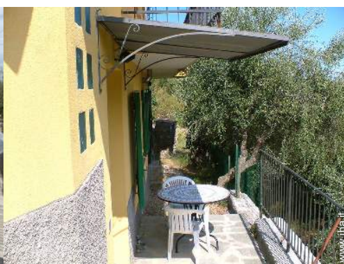
tettoia di giardino