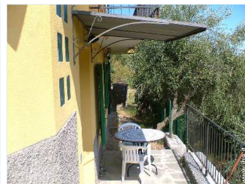
tettoia di giardino