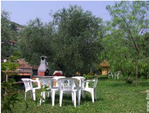
vista sul prato