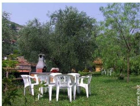
vista sul prato