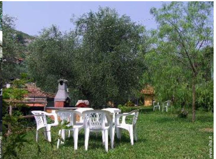
vista sul prato