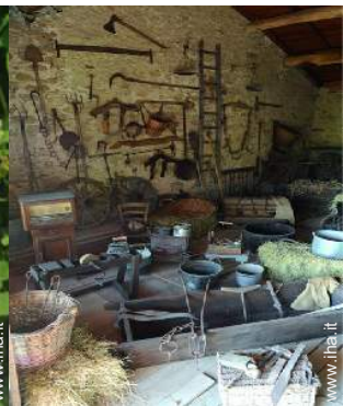
antichità &#38; anticaglie