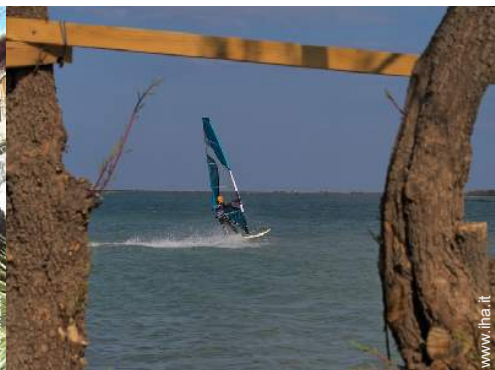
punto di windsurf