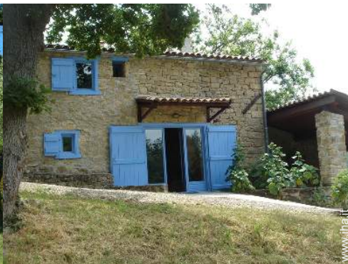
Attrezzature esterne a disposizione degli ospiti