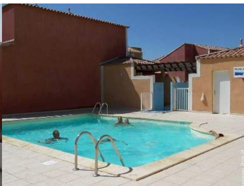
Installazione esterna a disposizione degli ospiti