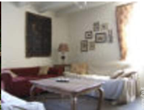
tavolo da ping-pong