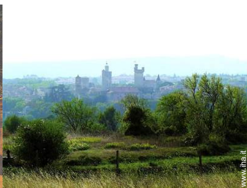
vista sulla città