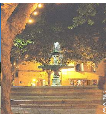
vista sulla piazza