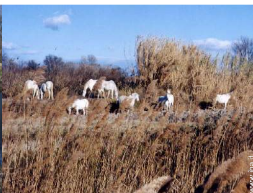
passaggiata a cavallo