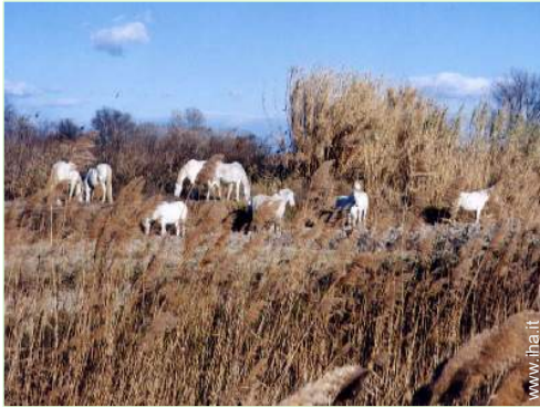
passeggiata a cavallo