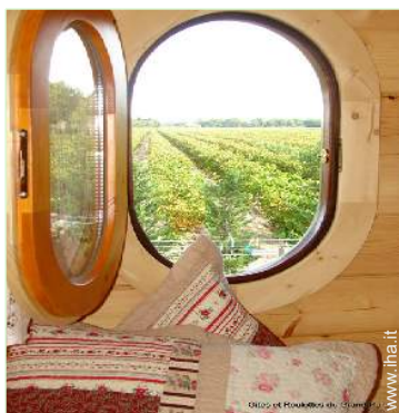
vista sui vigneti