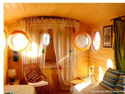
Roulotte di Charme