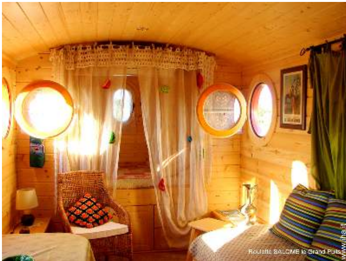
Roulotte di Charme