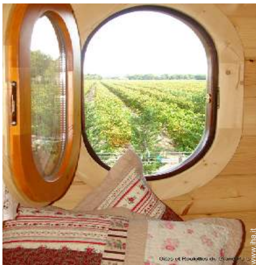
vista sui vigneti