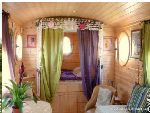
Roulotte di Charme