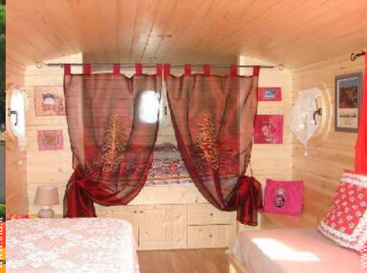
Roulotte di Charme