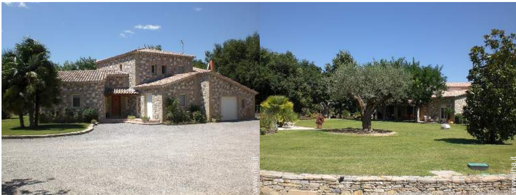
Villa di Charme