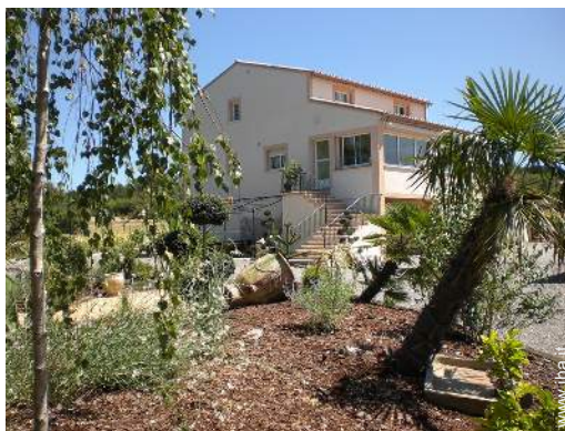
Villa di Charme