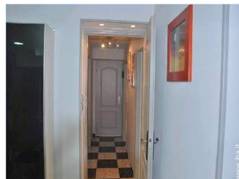
Disposizione interna e confort

Barbecue, tavolo da giardino, 8 sedia(e) da giardino, pergolato, 4 chaise(s) longue(s), 4 sedia sdraio