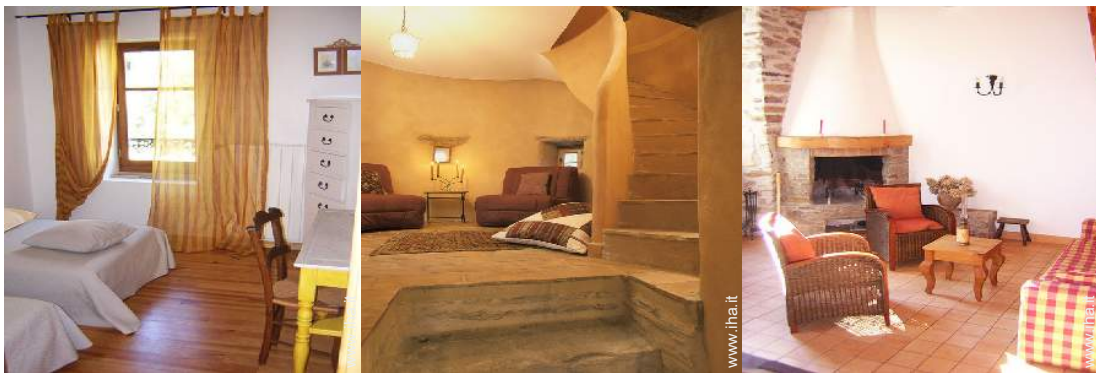
divano(i) letto 1 pers