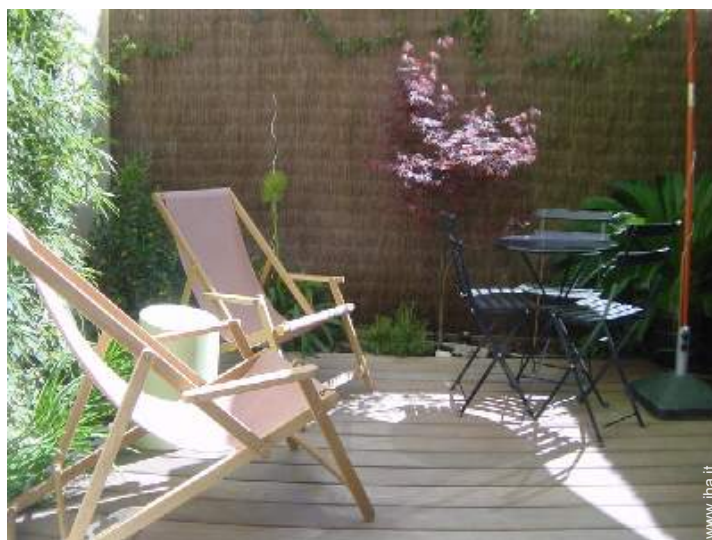
salotto da giardino