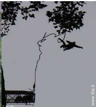
attività di volo nelle vicinanze