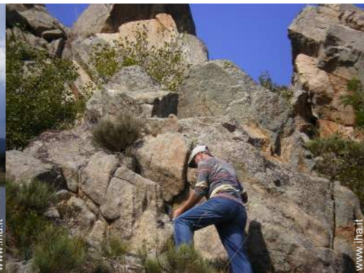
arrampicata su roccia