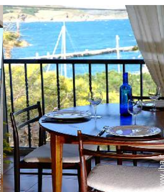
Appartamento di Charme