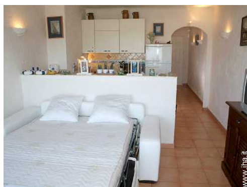
divano(i) letto 2 pers