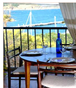
Appartamento di Charme