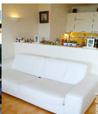
divano(i) letto 2 pers