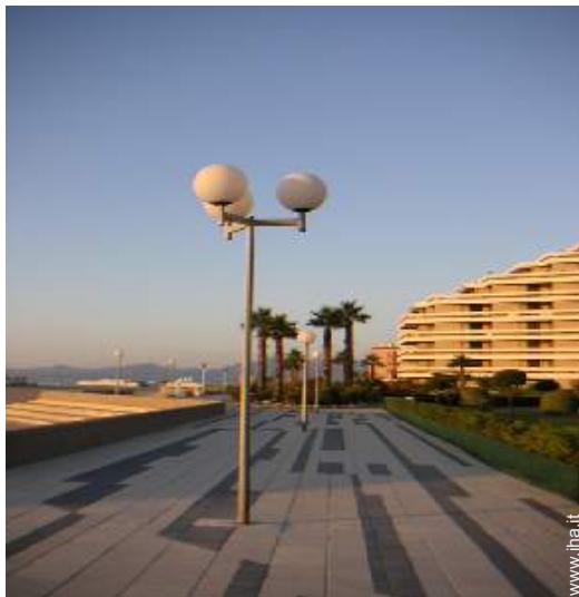
vista sulla strada pedonale