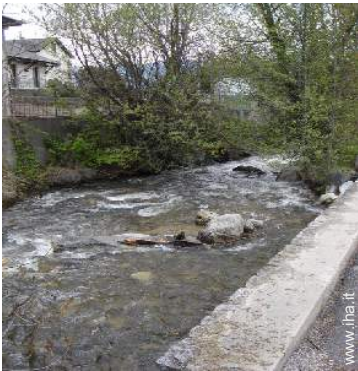
vista sul fiume