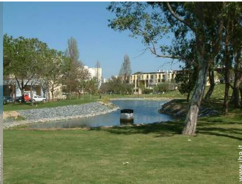
piscina fuori terra