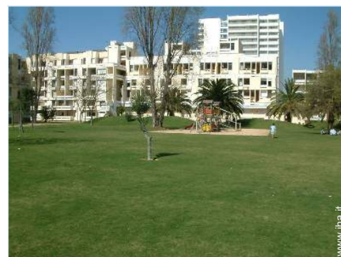
parco e giardino