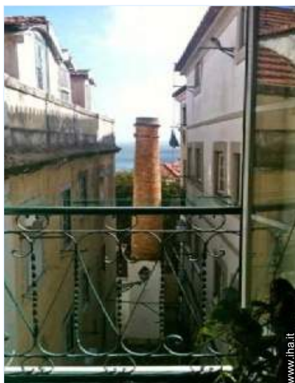
vista sul fiume