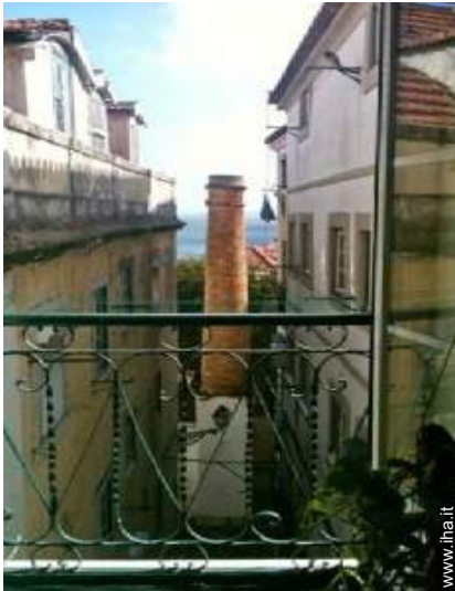
vista sul fiume