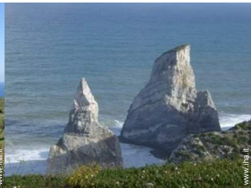
spiaggia dei nudisti