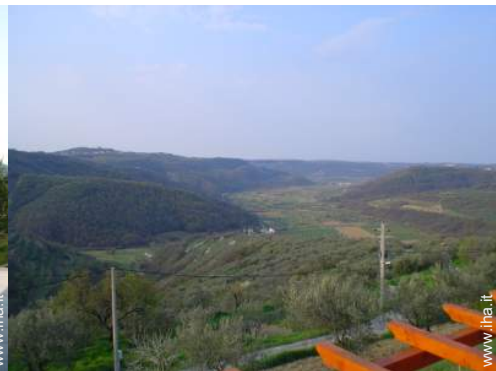
vista dal patio