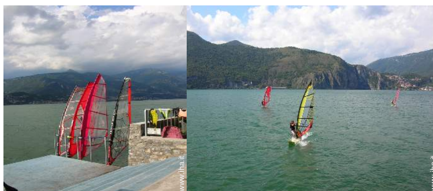
punto di windsurf