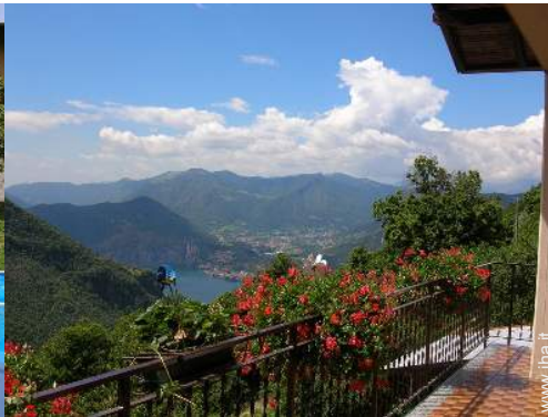
vista sul lago