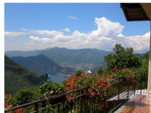
vista sul lago