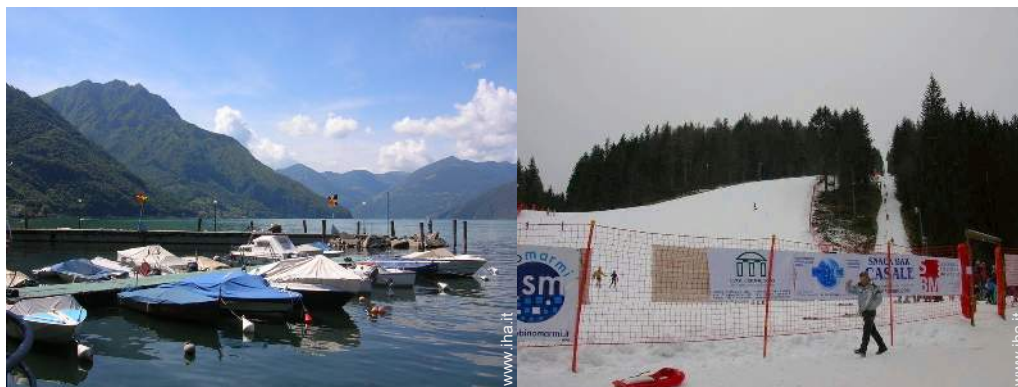
sport acquatici nelle vicinanze