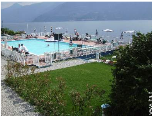
attività balneari nelle vicinanze