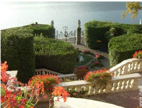
parco e giardino