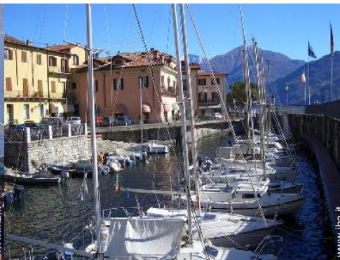
scalo di alaggio per la barca