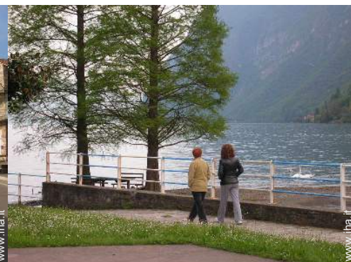
vista sulla strada pedonale