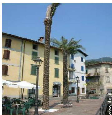
vista sulla strada pedonale