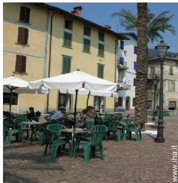
vista sul centro del paese