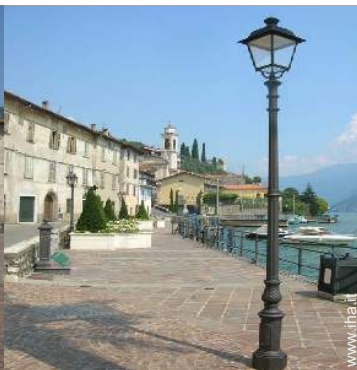
vista sul lago