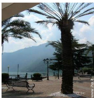
vista sul centro del paese