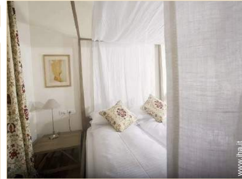
letto(i) matrimoniale(i) a baldacchino