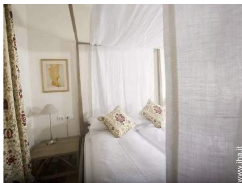
letto(i) matrimoniale(i) a baldacchino