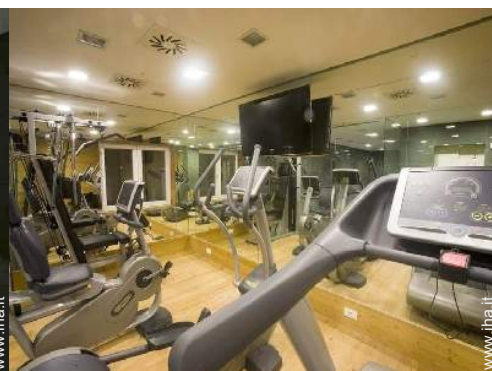
attrezzo(i) per il fitness