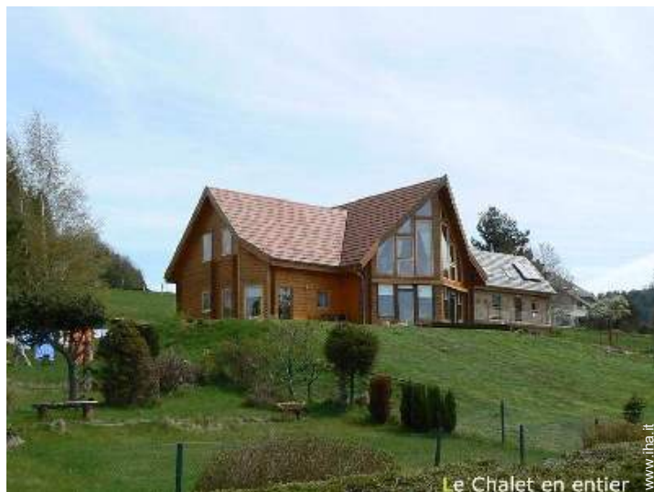
Le Chalet en entier