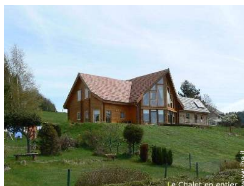
Le Chalet en entier