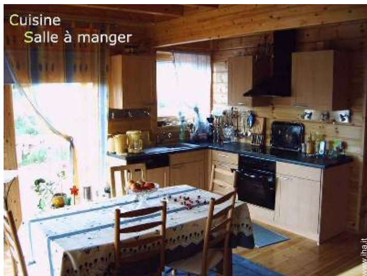
Cuisine Salle à manger