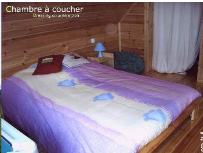
Chambre à coucher Dressing en arrière plan