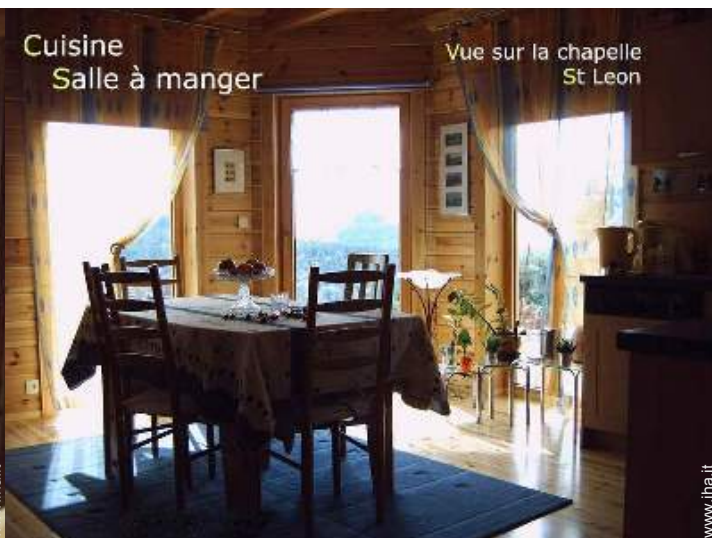
Cuisine Salle à manger