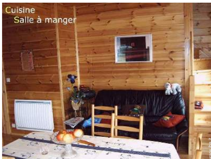
Cuisine Salle à manger