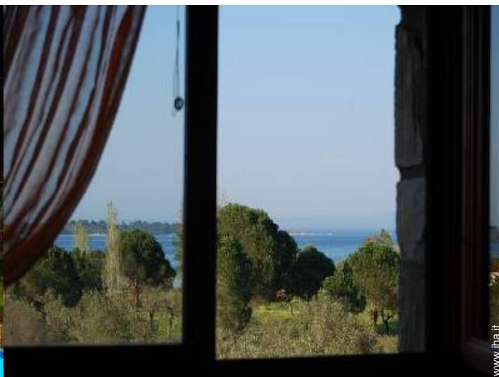
vista sul mare