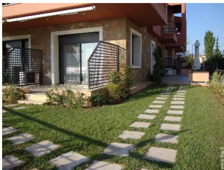
Studio di Charme