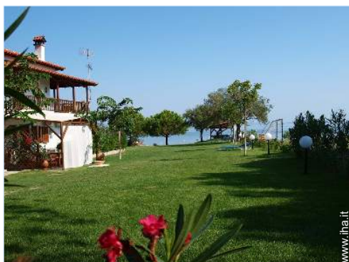
Residenza di Charme