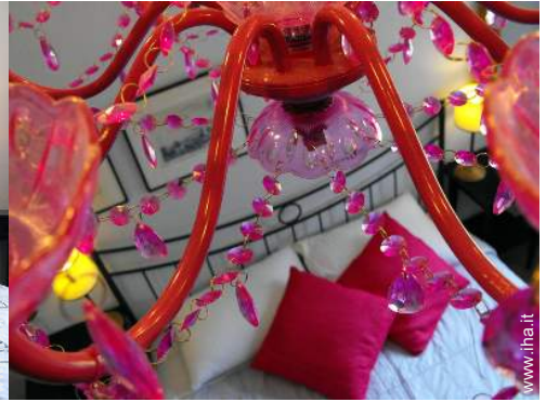
Residenza di Charme