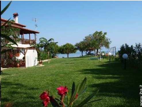
Residenza di Charme