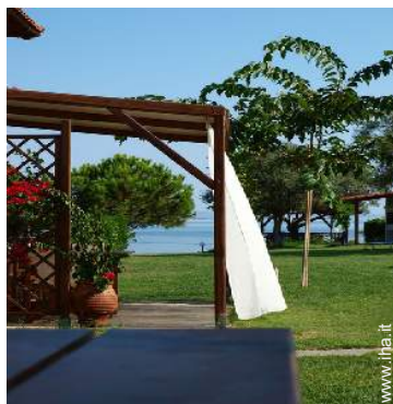
Residenza di Charme