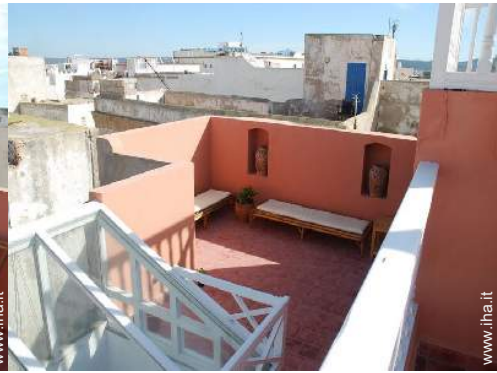
vista dalla terrazza sul tetto