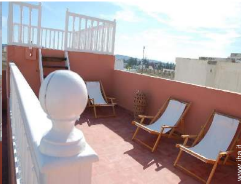
vista dalla terrazza sul tetto