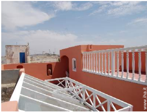
vista dalla terrazza sul tetto