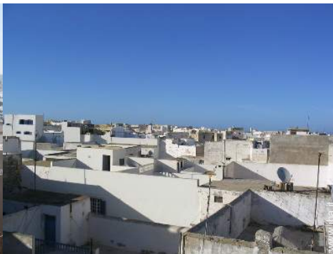
vista sui tetti