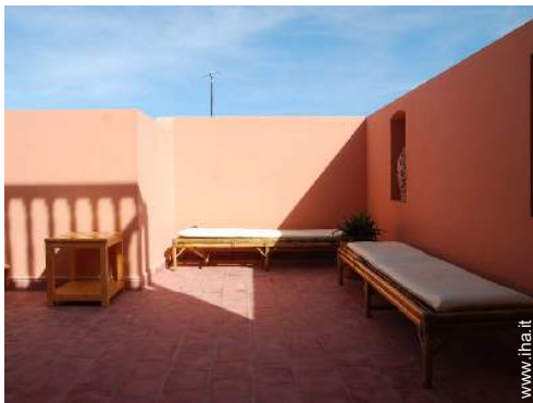
terrazzo sul tetto