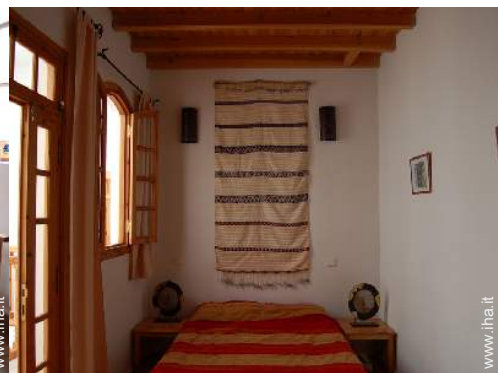
camera del proprietario