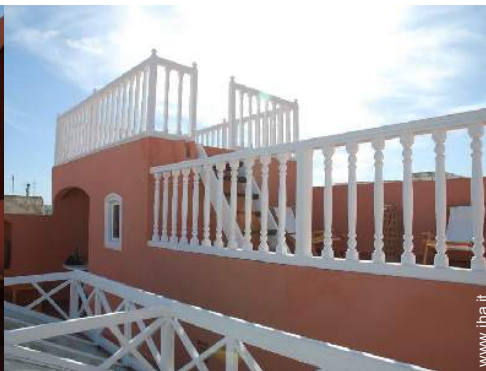
vista dalla terrazza sul tetto