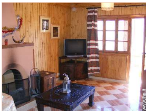
Chalet di Montagna Prestigio