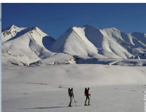
sci di fondo