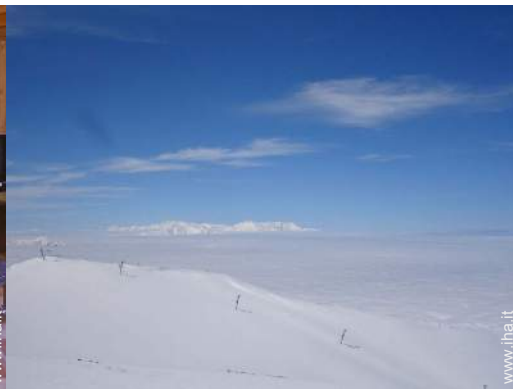
piste di sci