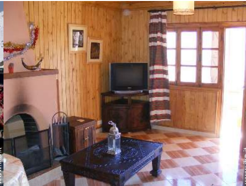
Chalet di Montagna Prestigio