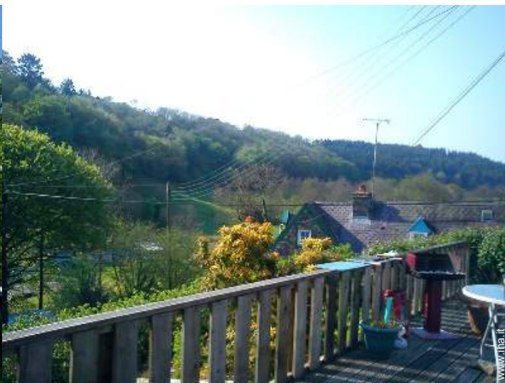
vista dal patio