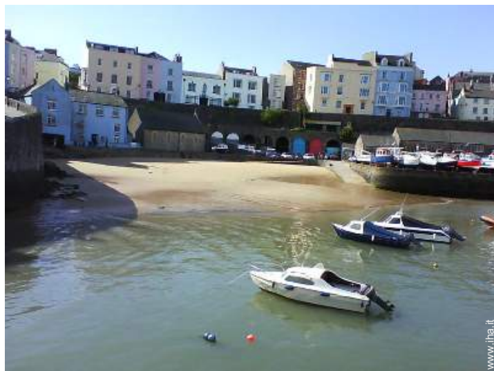
attrezzature ricreative nelle vicinanze