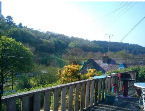
vista dal patio