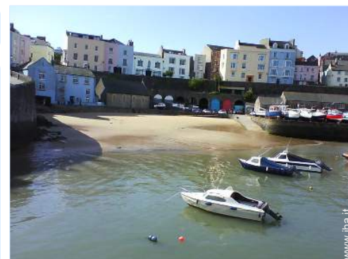
attrezzature ricreative nelle vicinanze

Barbecue, tavolo da giardino, sedia(e) da giardino, salotto da giardino