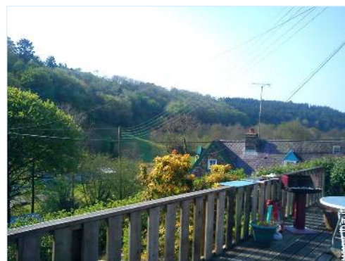
vista dal patio