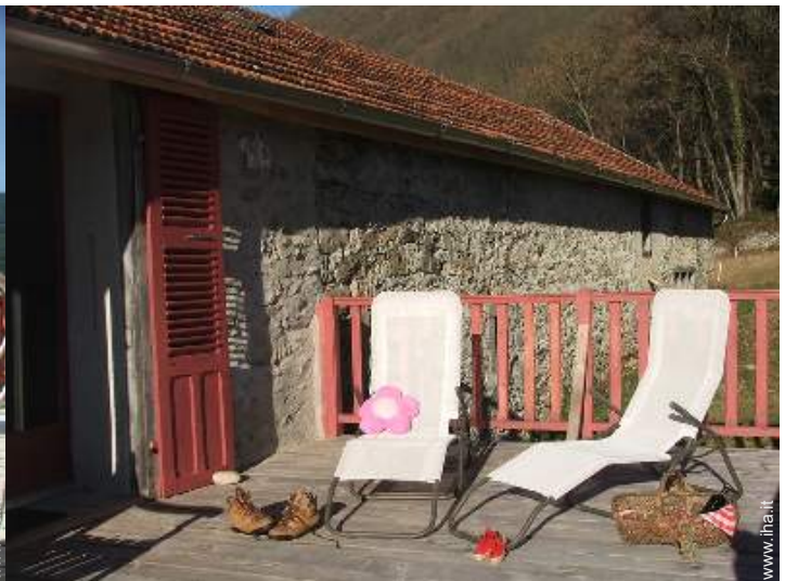
Casa in Pietra di Charme