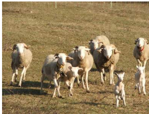
Gli animali domestici