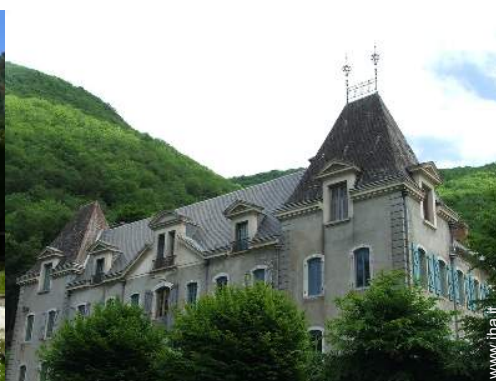
Proprietà di Charme