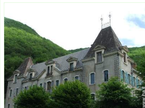
Proprietà di Charme