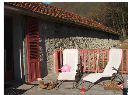
Casa in Pietra di Charme

Barbecue, tavolo da giardino, 6 sedia(e) da giardino, ombrellone, 5 chaise(s) longue(s)