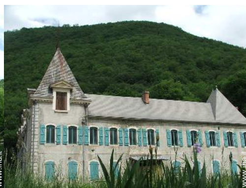
Proprietà di Charme