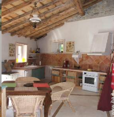
grande cucina indipendente