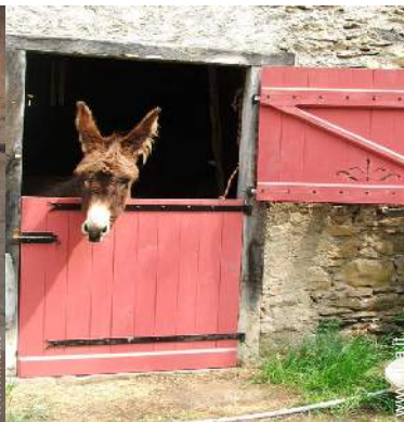
Gli animali domestici