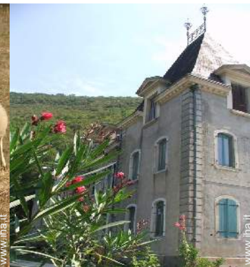
Ambito esterno a disposizione degli ospiti