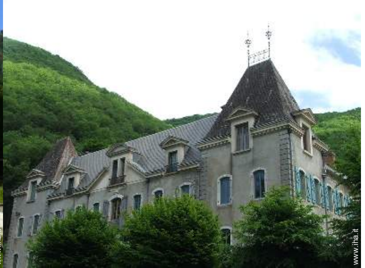
Proprietà di Charme