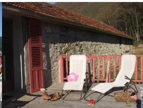
Casa in Pietra di Charme