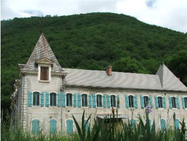
Proprietà di Charme