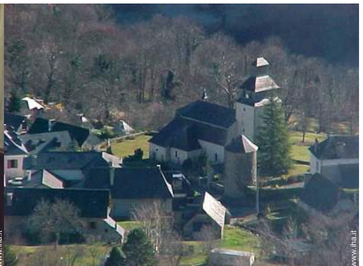
vista sul centro del paese