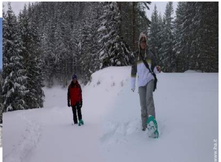
sport invernali nelle vicinanze