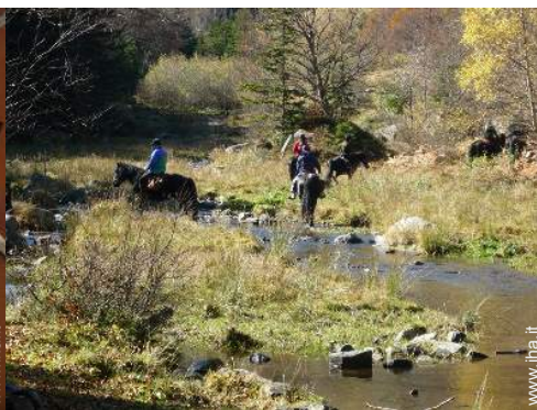
passaggiata a cavallo