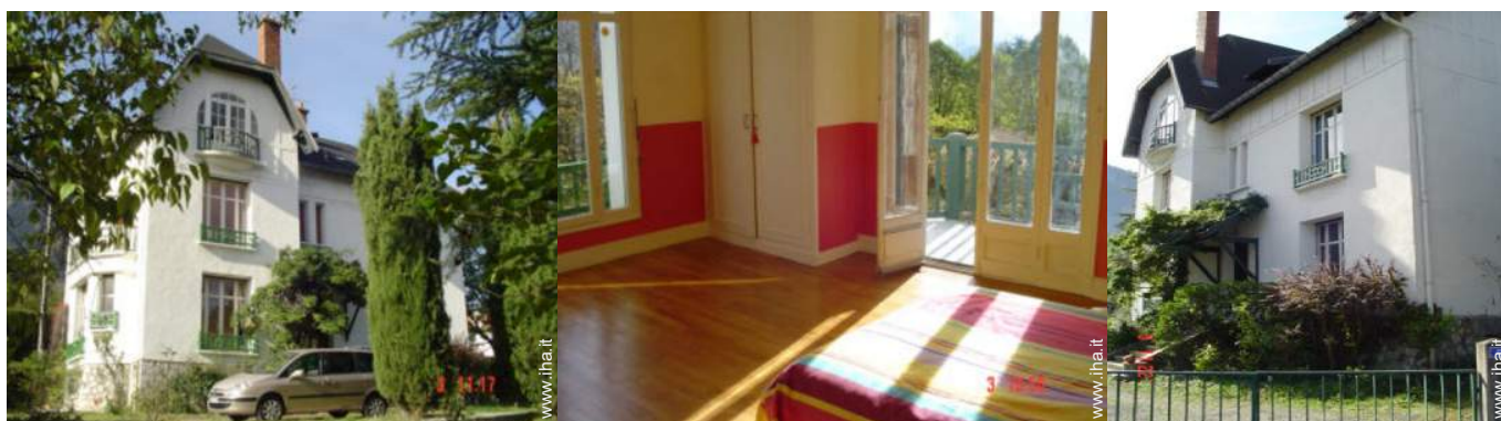
camera del proprietario