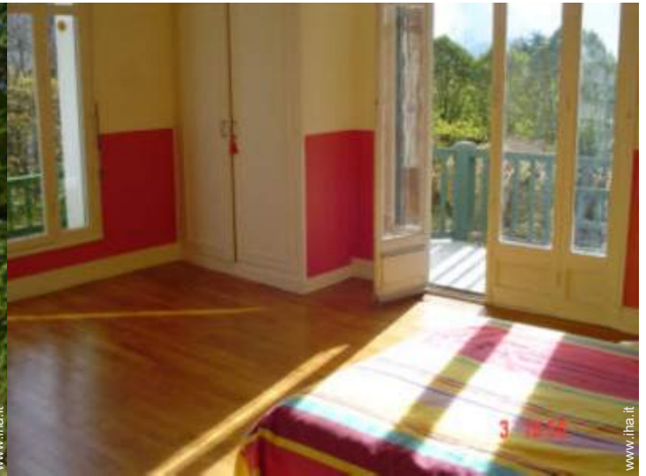
camera del proprietario