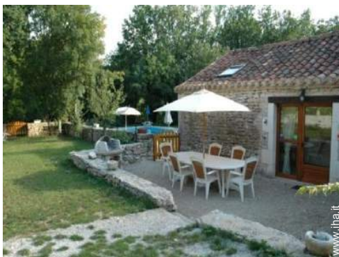
Casa in Pietra di Charme