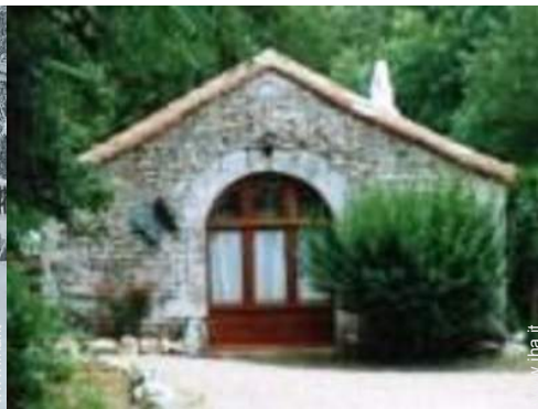
Proprietà di Charme