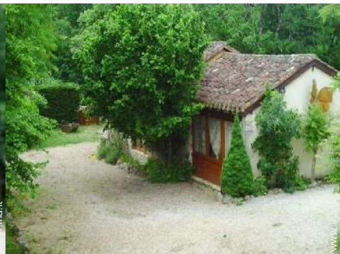
Casa in Pietra di Charme